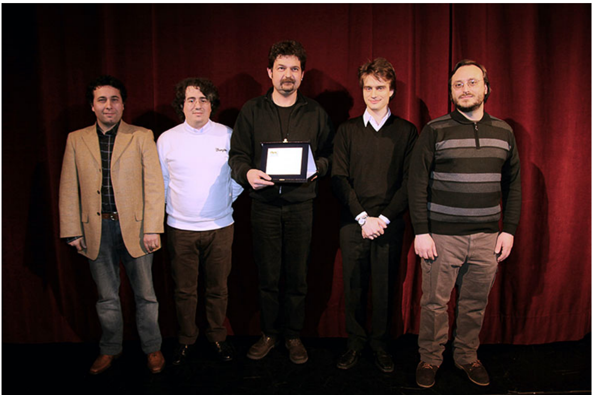
i finalisti della Terza Edizione