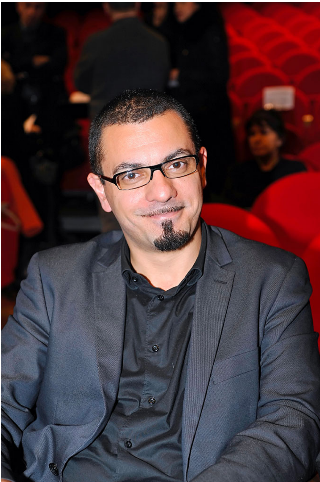
“American Poems” di Girolamo Deraco