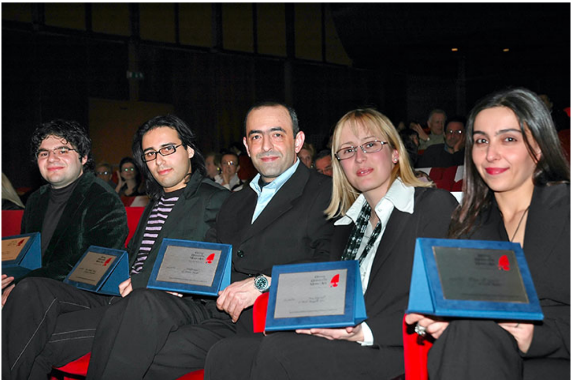
finalisti della seconda edizione